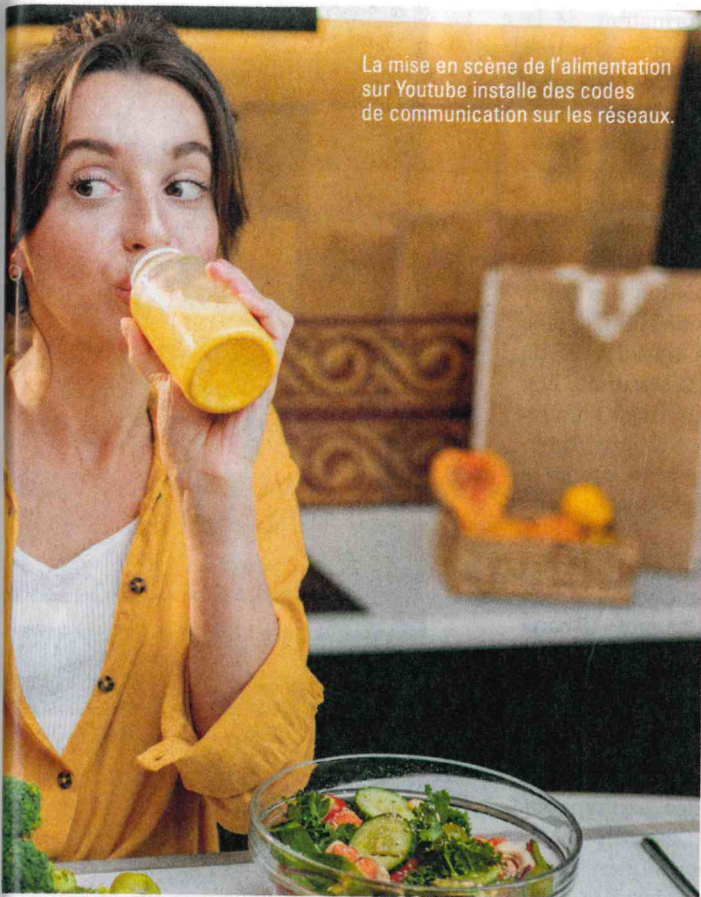
La mise en scène de l'alimentation sur Youtube installe des codes de communication sur les réseaux.