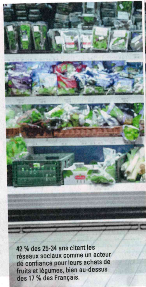
42 % des 25-34 ans citent les réseaux sociaux comme un acteur de confiance pour leurs achats de fruits et légumes, bien au-dessus des 17 % des Français.

Quel est votre idéal alimentaire ? C'est une des questions que les étudiants en sociologie des deux écoles d'agronomie de Montpellier et Toulouse ont posé à quarante-quatre jeunes de leur âge, venus d'un milieu social différent, à la fin de 2023. L'intention n'était pas d'en faire une étude statistique mais de sentir les perceptions de cette génération. Il en ressort que les normes alimentaires, formalisées dans le plan nutrition santé, ont bien imprégné les esprits mais qu'elles ne se traduisent pas dans les faits. Les contraintes de pouvoir d'achat, de temps pour cuisiner ou d'espace dans les chambres d'étudiants créent un écart avec les règles et renvoient aux individus la responsabilité du bien manger. « J'ai conscience de la norme mais... », rapporte une étudiante enquêtrice. D'ailleurs, la consommation de viande rentre typiquement dans ce cadre. Ce n'est pas tellement la conscience écologique qui en limite l'achat chez les jeunes interrogés, mais tout bonnement l'argent. Il apparaît aussi que l'héritage familial dans les habitudes culinaires persiste, en passant parfois par une réappropriation des plats traditionnels par les jeunes issus de cultures étrangères.